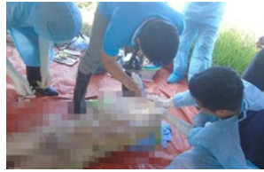
Vụ khai quật tử thi nữ kế toán: Luật sư nói chiếc bật lửa cạnh thi thể nạn nhân chưa được làm rõ 1 ngày trước