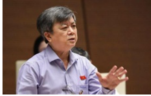
ĐBQH: Lùi Dự Luật đặc khu thể hiện sự "lắng nghe" nhân dân của Chính phủ, Quốc hội 23 giờ trước