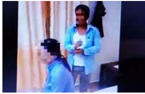
Vụ chồng bắt quả tang vợ trong nhà nghỉ với bạn thân: Phải còng cổ thêm chứng cứ Nổi bật