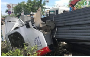
Hàng trăm thanh dầm thép bị rơi, hất phần cabin container và tài xế bay xuống đường 20 giờ trước