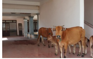
Nhường đất cho cty Formosa, trụ sở mới trị giá 33 tỷ đồng thành nơi trú ngụ của trâu bò, Bí thư xã nói gì? 1 ngày trước