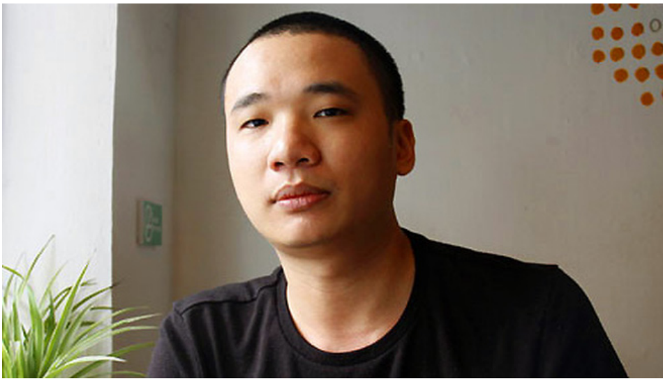
Nguyễn Hà Đông - cha đẻ của game Flappy Bird đình đám.