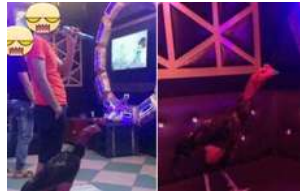
Tâm sự cười chảy nước mắt của cô vợ đòi ly dị vì chồng mê gà chọi: Đang ân ái nhảy bổ xuống kiểm tra chuồng, đem cả gà đi hát karaoke