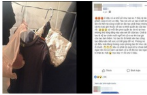
Lời "cầu cứu" của anh rể: Sống chung với em vợ còn khổ hơn ở với mẹ chồng Nổi bật