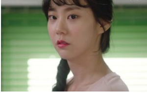
Bạn trai lâu năm đột ngột gửi vào tài khoản cho 100 triệu với lí do khiến cô gái "chết nửa linh hồn"