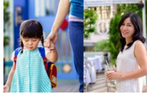
Mẹ giục "con chào cô đi" và phản ứng của trẻ khiến người phụ nữ ước giá như không ở đây