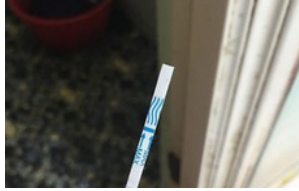
Vừa quyết định ly hôn thì que thử thai 2 vạch cũng hết, chị em nghi cô vợ này phản ứng thế nào?