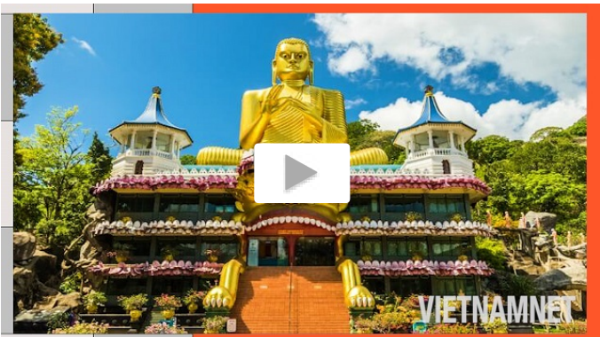
Choáng ngợp trước hàng động tượng Phật dát vàng ở Sri Lanka